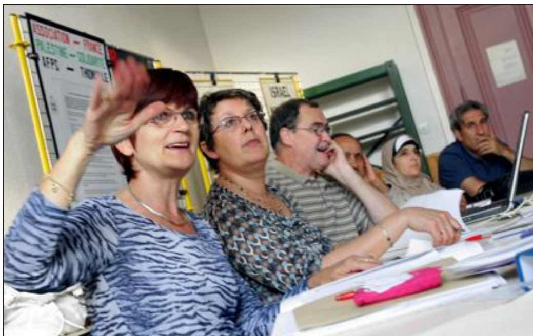
Pour des raisons techniques, la section thionvilloise de l'AFPS a décidé de conduire sa gestion en année civile. Sa prochaine assemblée générale aura donc déjà lieu en décembre prochain.

Puis est venu le récapitulatif des actions menées sur cet exercice. Entre autres, la participation du groupe local au Festival du film arabe de Fameck dont le pays phare était la Palestine, la mission menée par des membres du groupe en Cisjordanie autour du Projet eau pour le village maraîcher de Wadi Fukin menacé par la construction et l'extension de l'énorme colonie de Betar Illit (ce projet est désormais soutenu par le conseil régional mais aussi