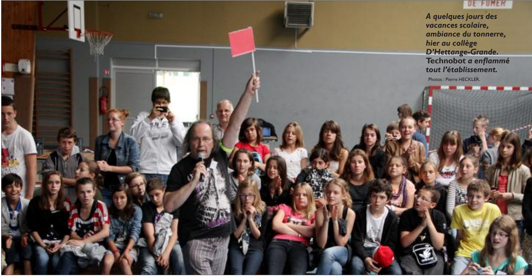
A quelques jours des vacances scolaire, ambiance du tonnerre, hier au collège D'Hettange-Grande. Technobot a enflammé tout l'établissement.