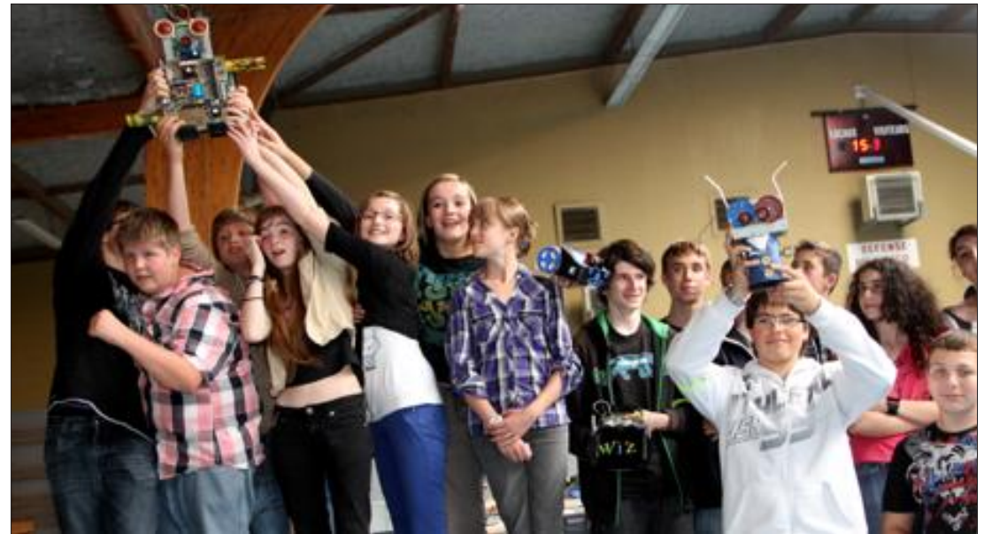
Les équipes gagnantes brandissent leurs trophées... Des robots immobiles réalisés par la professeur d'arts plastiques du collège d'Hettange. A propos, c'est Hettange qui a gagné... presque anecdotique !